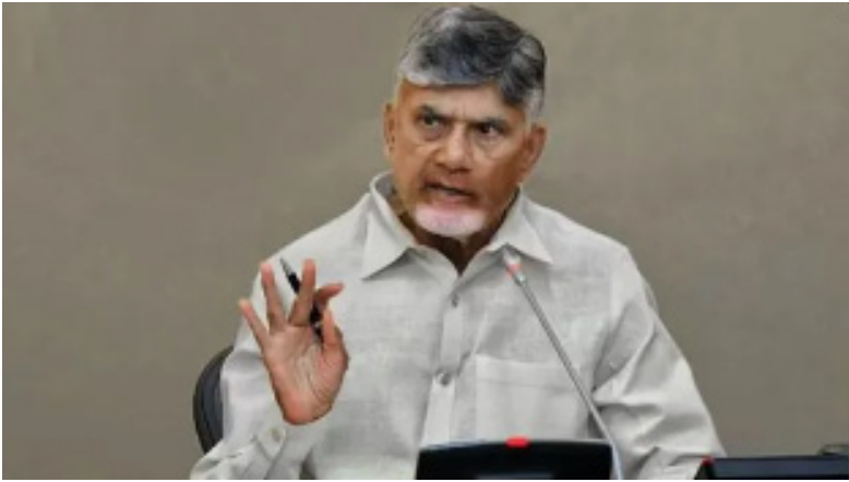
ధర రూ.4గా ఉండేలా తగ్గించాలన్నారు. నూతన టెక్నాలజీని,

విద్యుత్ శాఖ అధికారులతో సీఎం చంద్రబాబు నాయుడు మంగళవారం సమీక్ష నిర్వహించారు. సవలయంలో జరిగిన ఈ సమీక్షలో పలు కీలక సూచనలు చేశారు సీఎం. విద్యుత్ కొనుగోలు ఛార్జీలను తగ్గించే అంశంపై అధికారులు దృష్టి సారించాలన్నారు. ఆ దిశగా చేపడుతున్న చర్యలను మరింత ముమ్మరం చేయాలని ఆదేశించారు. ప్రభుత్వం చేపట్టే విద్యుత్ కొనుగోలు ధరను యూనిట్కు రూ.4కు తగ్గించటం సహా ప్రజలపై భారం వేయకుండా విద్యుత్ సంస్థల రుణాలు తీర్చేందుకు కార్యాచరణ చేపట్టాలని అధికారులకు సూచించారు.